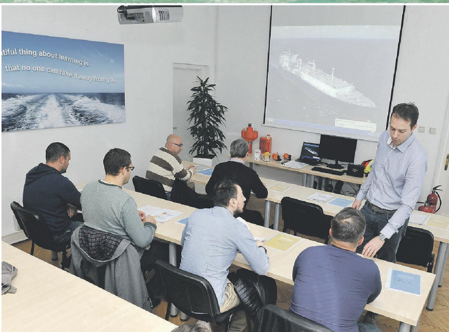
Preko treninga do broda